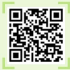
배우 및 모델 직업소개