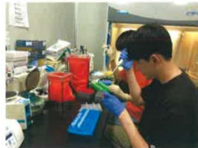
(말라리아바이러스 PCR 전처리 과정)